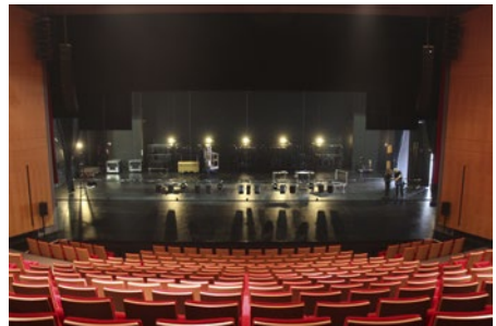
Salle Barbara Hendricks