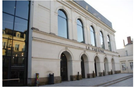
Facade du Théâtre

Ce moment est souvent riche, mais il peut être impressionnant. Aussi il est indispensable de préparer ce temps d'échanges en amont. Une fiche médiation "Rencontre en bord de scène" est disponible en téléchargement sur notre site internet.