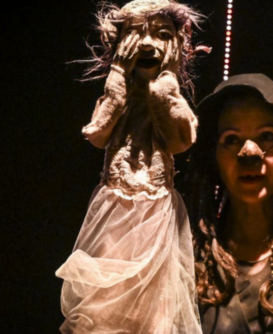
La Manekine - C* La Pendue