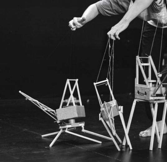
Chantier Parades - C e Portés Disparus