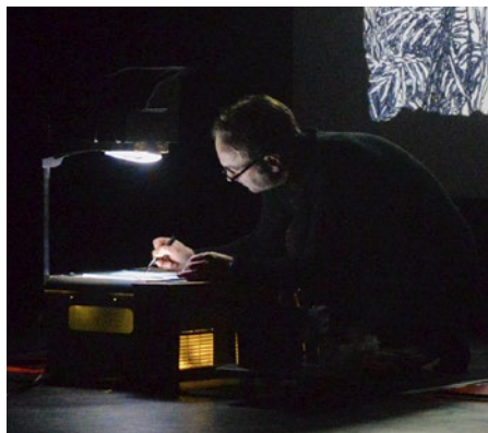
Murmures de la forêt · Ensemble Instrumental de la Mayenne, François Soutif