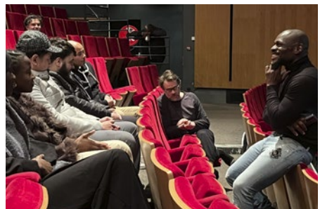
Bord de scène