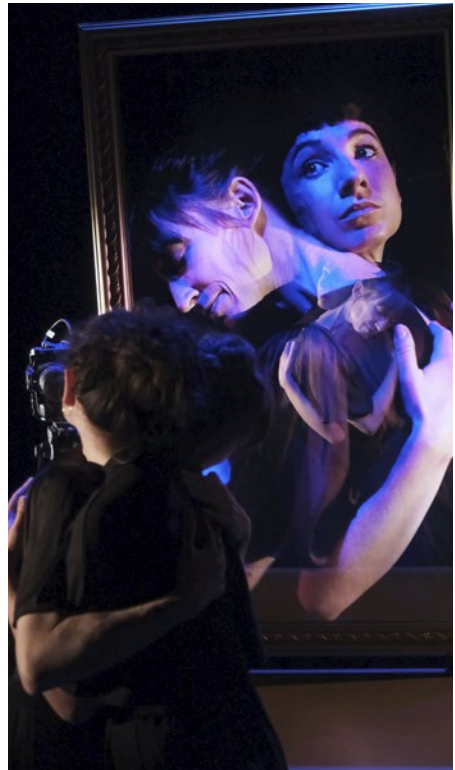
La Pomme empoisonnée - Pan ! La C e

→ letheatre.laval.fr/ espace-ressources/