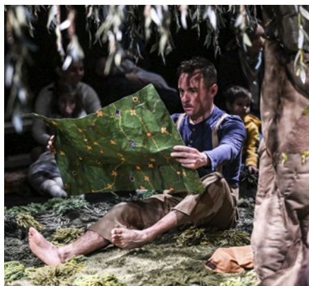
Sous l'arbre · C* À demain mon amour