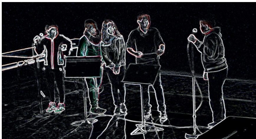
Atelier enfant "Cherche ton conférencier" avec le Théâtre Nouvelle Génération, Lyon