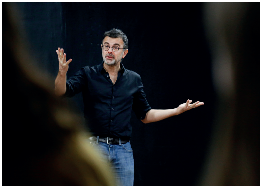
Rencontre avec des étudiants dans le cadre du Pop Up de la Villette