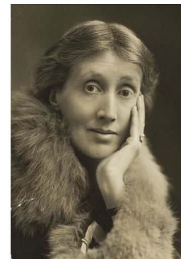
Virginia Woolf en 1927

Virginia Woolf grandit entourée de la haute société au sein d'une famille recomposée. Son père est particulièrement féru de littérature, berçant donc sa fille dans cet environnement dès son plus jeune âge. Subissant de nombreux traumatismes durant son enfance au sein de sa famille, la jeune fille devra supporter le décès de sa mère et de sa sœur ainsi que des violences répétées de la part de ses demi-frères. Souffrant de ces événements, l'écriture de Virginia Woolf en est influencée, se concentrant sur le moi-intérieur, elle dévoile une évolution non linéaire de la manière de penser de ses personnages. La cause du féminisme fait également partie intégrante de ses romans, dans lesquels elle défend le droit des femmes d'avoir accès à la même éducation que les hommes.