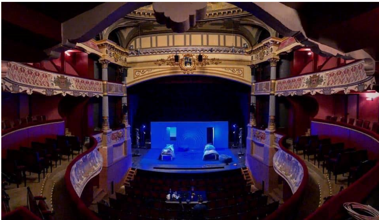
Première du spectacle au théâtre de La Coupe d'Or – Théâtre de Rochefort