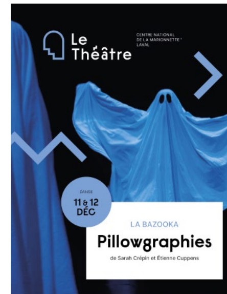
Affiche de Pillowgraphies

Ces affiches représentent un très bon support pour parler du spectacle et avoir une première approche de celui-ci. Il est intéressant de l'accrocher dans la classe dès sa réception afin que les élèves puissent la voir régulièrement et qu'ils se préparent ainsi au spectacle.