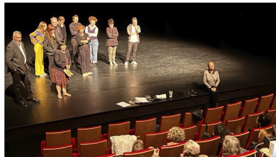
Répétition ouverte mardi 27 septembre.