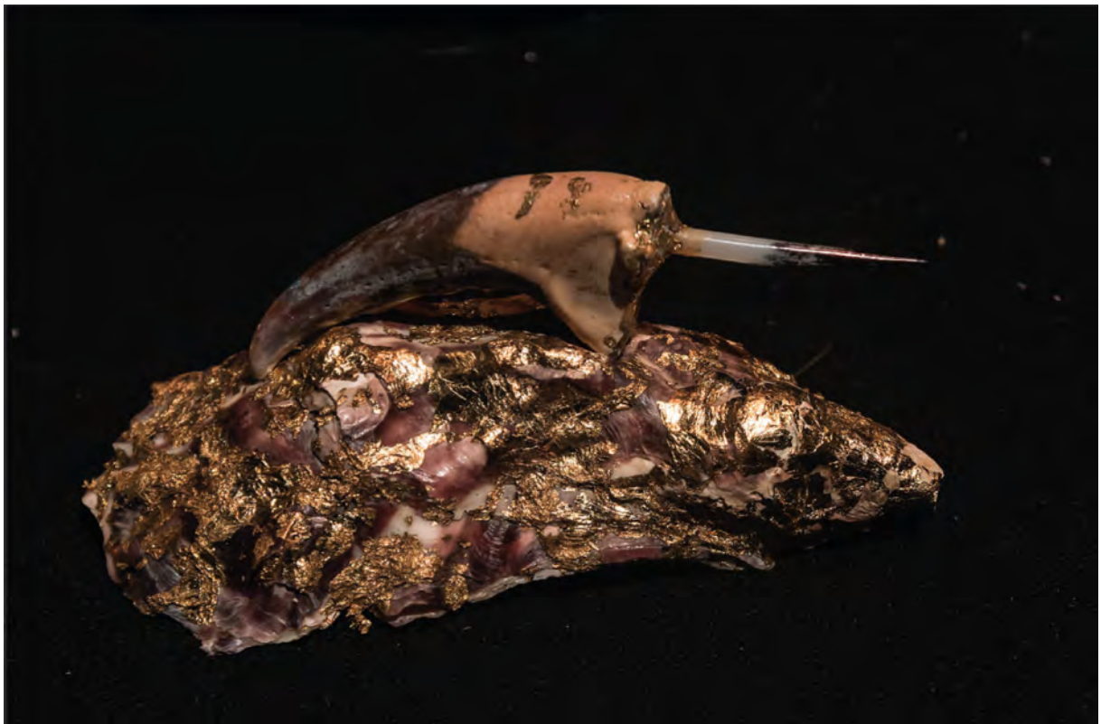
D6 - SPECIAL FRUITS DE MER - Doré à la feuille, ce superbe spécimen a été retrouvé dans l'épave du Titanic.