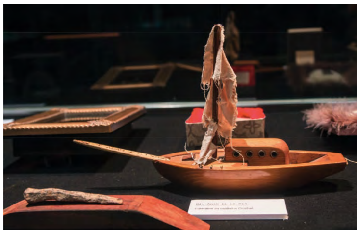
CURE DENT DU CAPITAINE CROCHET

Arrivée à Saint-Malo, elle constate avec stupeur qu'elle ne parle plus un mot d'anglais mais qu'elle maîtrise parfaitement le français... À sa connaissance des dents s'ajoute alors la connaissance de la langue et c'est ainsi doté qu'elle file en Mayenne... Bien des années passent, riches en aventures diverses et variées et c'est en juin 2020 que nous la retrouvons lors de l'ouverture du Musée Mondial du Cure-Dent au Théâtre de l'Échappée.