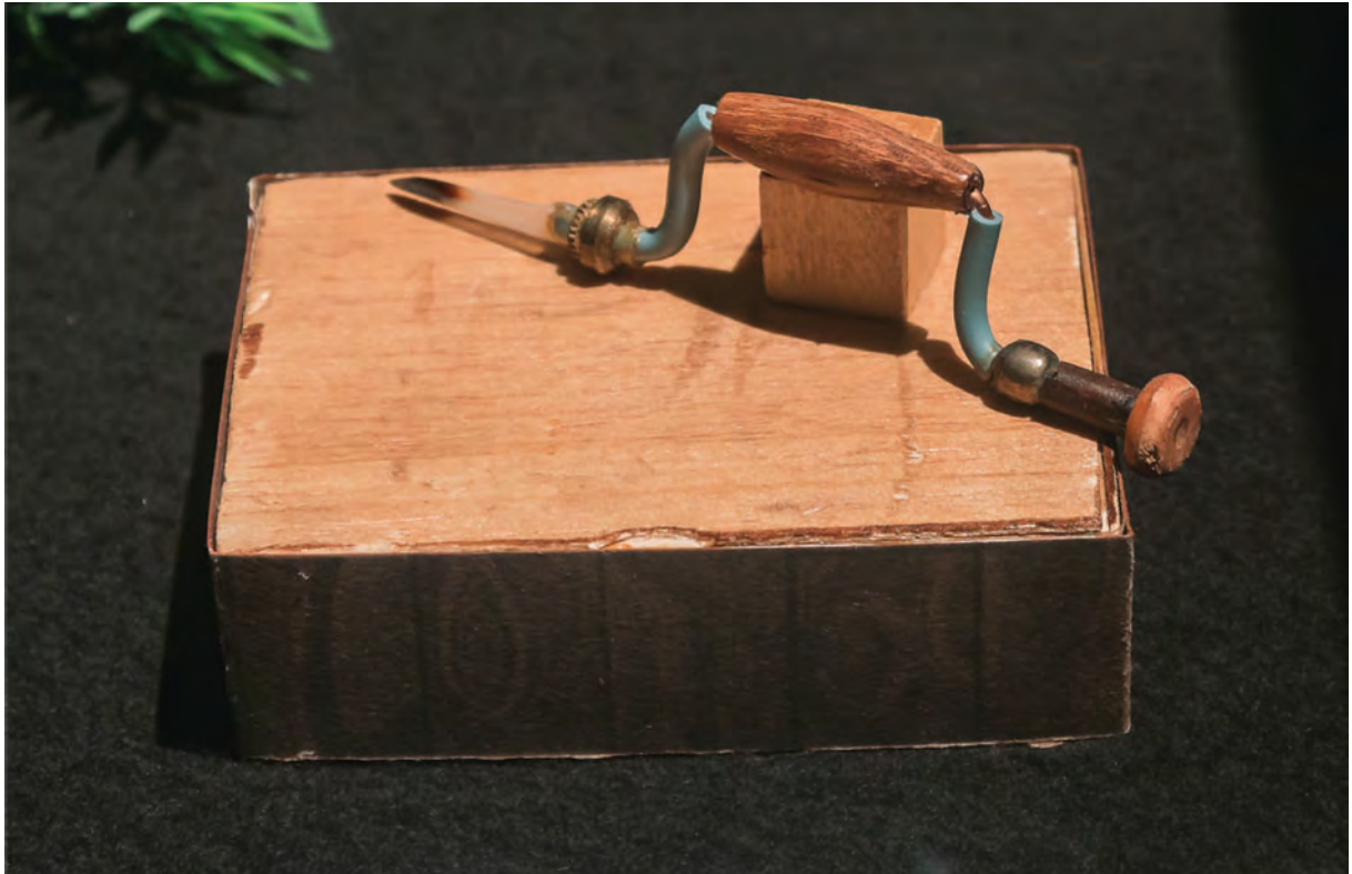
U7 – VILEBREQUIN - Vient à bout des dépôts les plus rebelles.

«La pataphysique est la science des solutions imaginaires.» Alfred Jarry