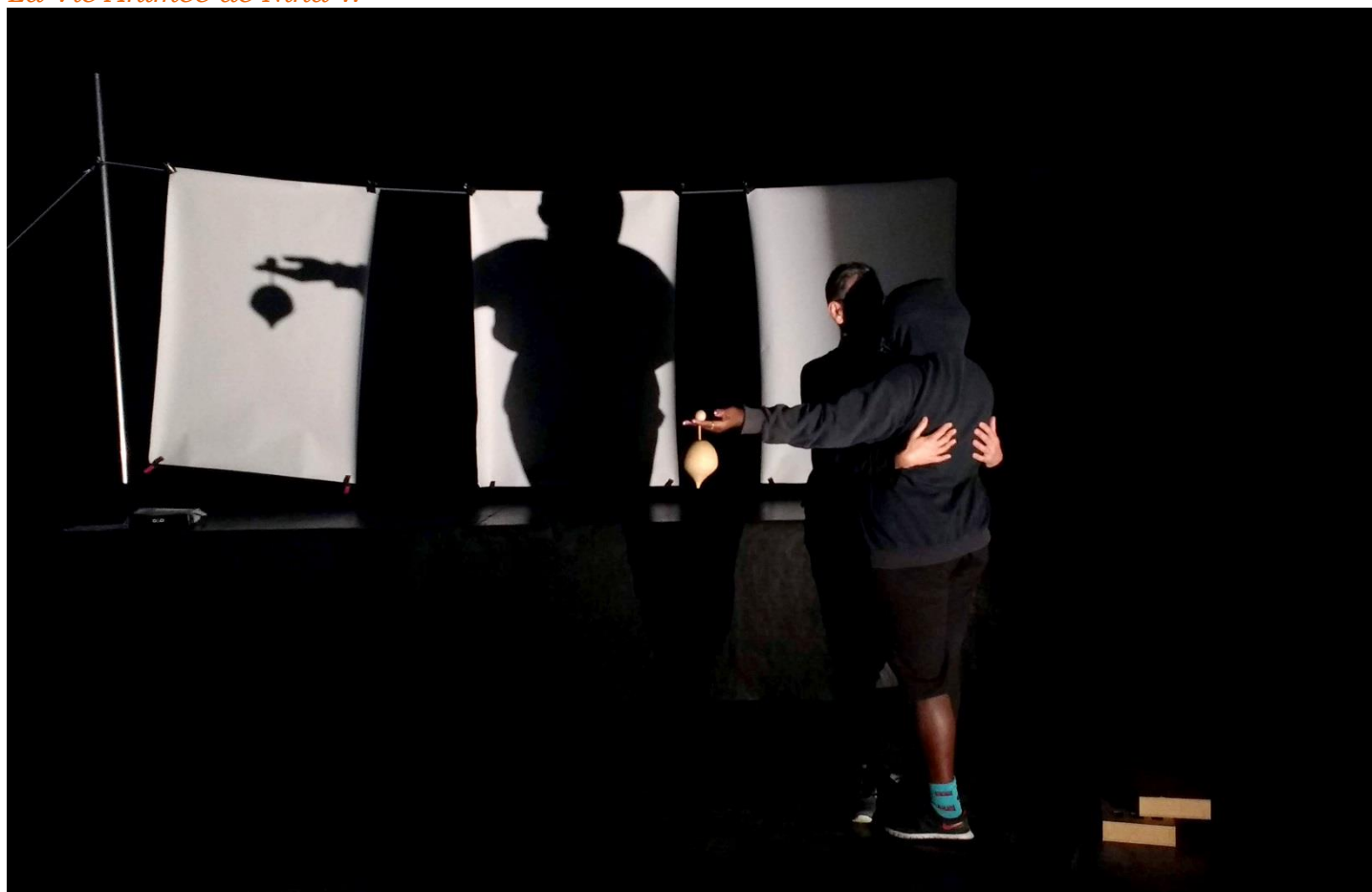
La Vie Animée de Nina W