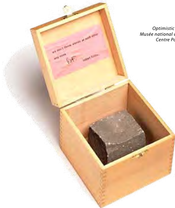
Robert Filliou Optimistic Box n° 1, 1968 Musée national d'Art moderne, Centre Pompidou, Paris