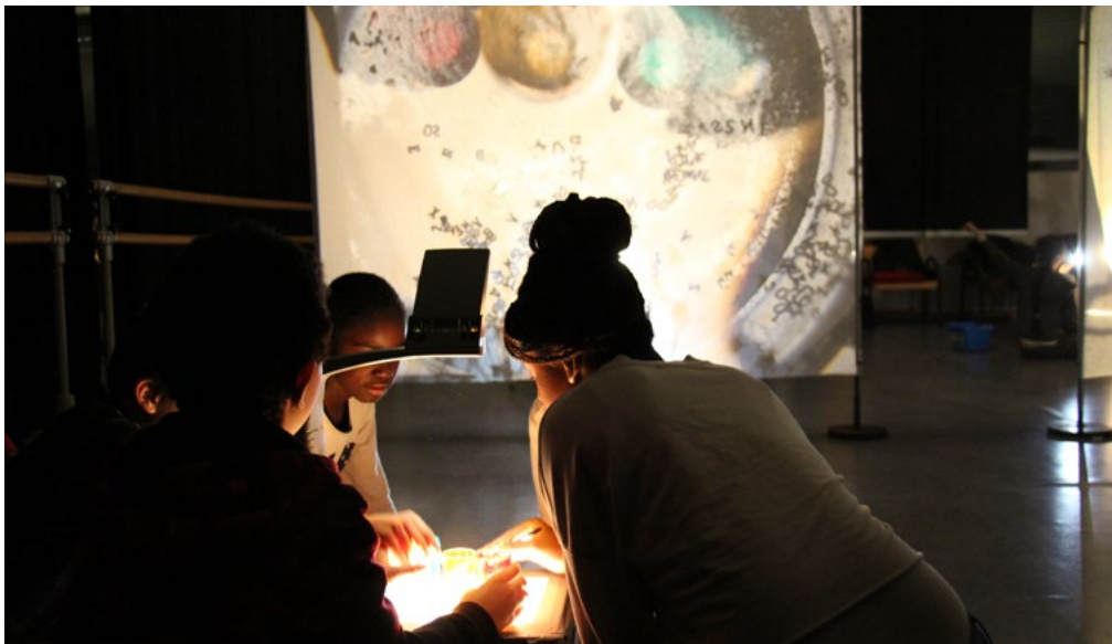
Atelier image projetée avec la compagnie les Mauvaises Herbes - saison 2018/2019

Attention : cette démarche concerne uniquement les voeux pour les spectacles. Pour les parcours et Quartiers en scène, merci de remplir l'appel à projet sur temps scolaire.