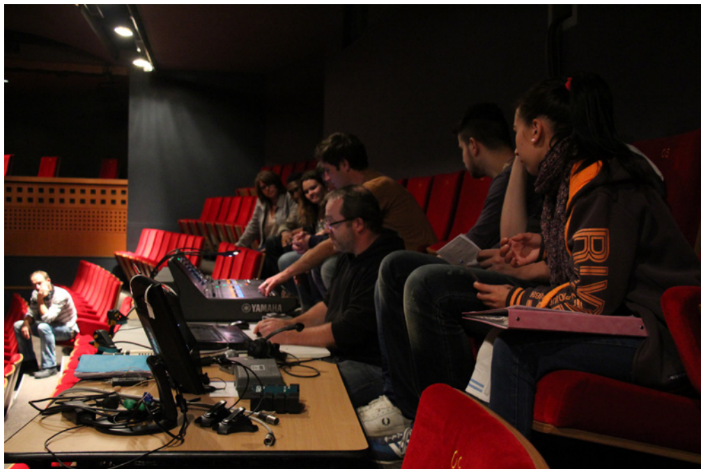
Visite Technique du Théâtre de Laval dans le cadre d'un parcours mené en 2016-2017

Les parcours ne pourront concerner que 2 classes chacun. Si les demandes sont plus importantes que les places disponibles, nous nous référerons au critères de priorisation (voir p. 10).